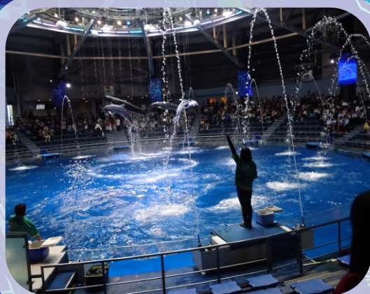
マクセルアクアパーク品川に行っ てきました。

プロジェクションマッピングや光 の演出などで彩られた魚たちがとて もきれいでした！