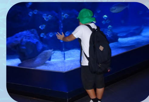
ライトアップされた水槽。 きれい！