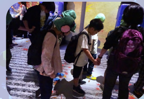
プロジェクションマッピングで 床に紅葉が映っていました。